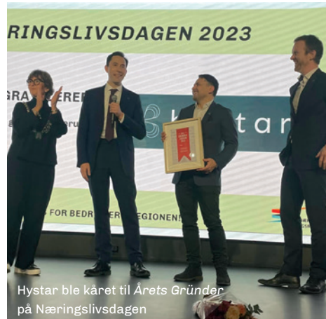
Hystar ble kåret til Årets Gründer på Næringslivsdagen

StartUp Asker og Bærum er et samarbeid mellom kommunene i Asker og Bærum, og Viken fylkeskommune. Tjenesten ble i 2023 drevet av Re Gründerhus, Inclusion, Asker Næringsforening og Bærum Næringsråd.