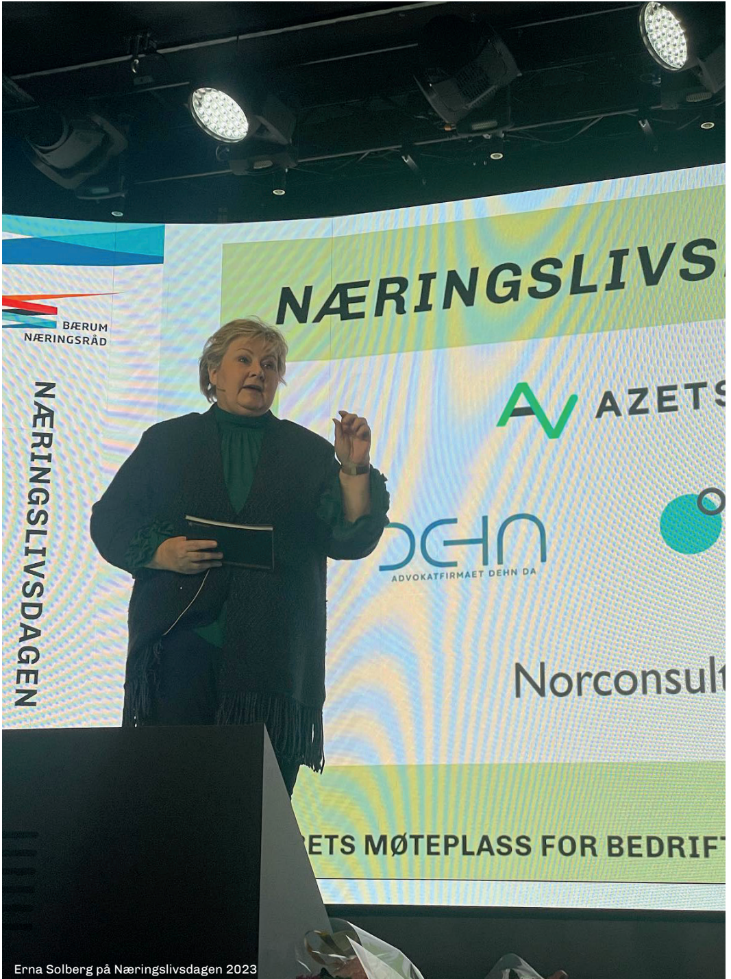
Erna Solberg på Næringslivsdagen 2023