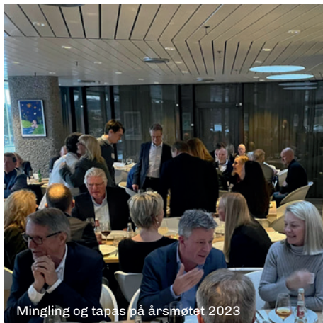
Mingling og tapas på årsmøtet 2023

Vi er opptatt av å se kompetanse som mulighet for næringslivet, uavhengig av bakgrunn, alder, kjønn og etnisk opprinnelse