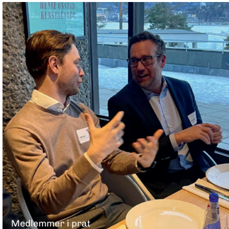
Medlemmer i prat

Årlig etablerer det seg flere hundre nye bedrifter i Bærum, og vi skal være de første som ønsker nyetablerte bedrifter velkommen på næringslivsarenaen.