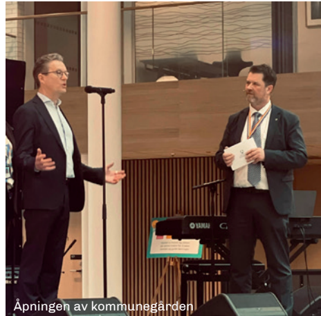
Åpningen av kommunegården

Våre medlemmer tar del i et unikt faglig og sosialt næringsnettverk hvor potensielle samarbeidspartnere og forretningsforbindelser også er medlemmer.