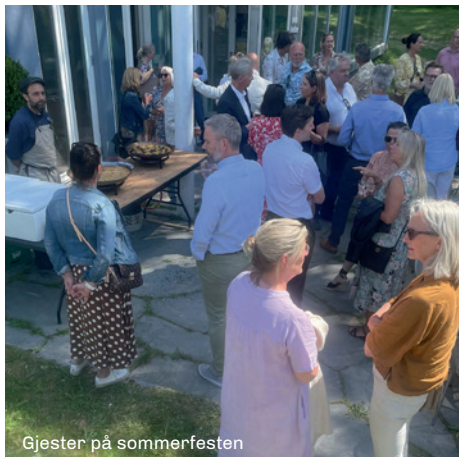
Gjester på sommerfesten