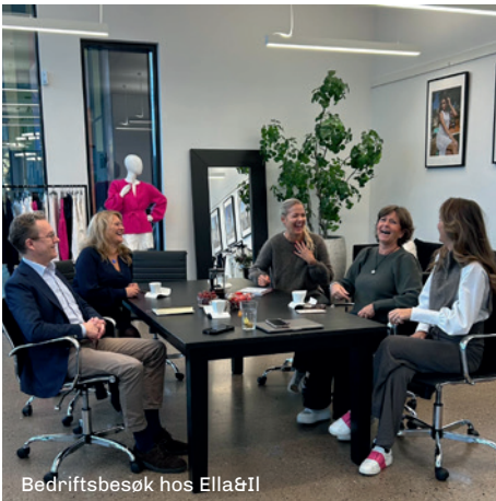
Bedriftsbesøk hos Ella&I