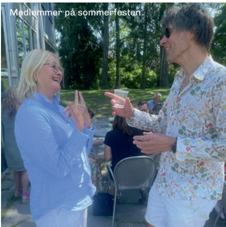
Medlemmer på sommerfesten