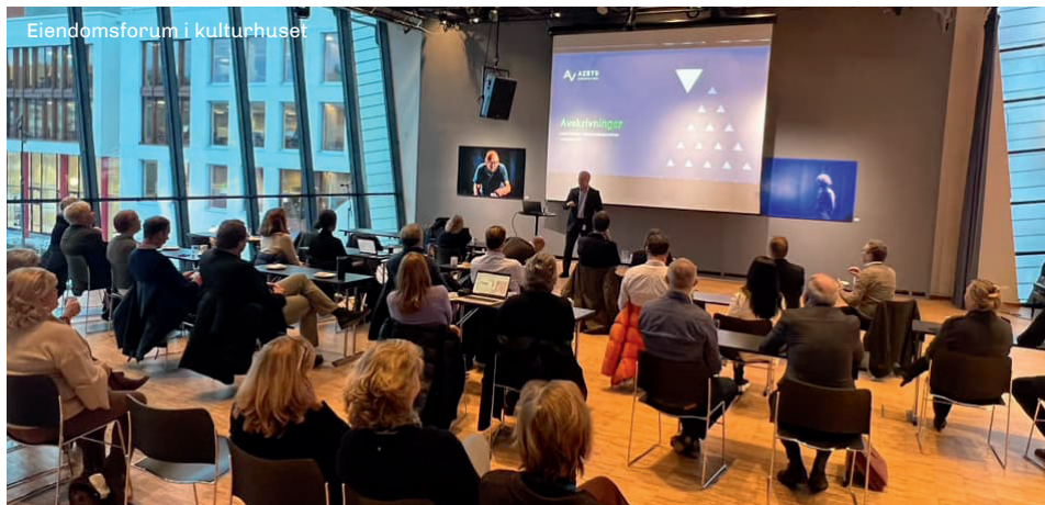
Eiendomsforum i kulturhuset