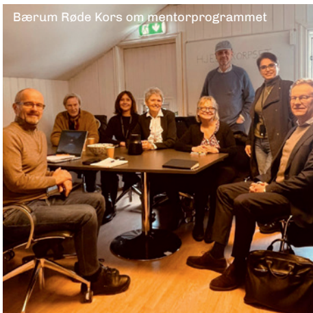
Bærum Røde Kors om mentorprogrammet

Kommunestyret i Bærum har vedtatt en næringsplan som legger opp til å styrke arbeidet med de etablerte gründermiljøene, bl.a. gjennom partnerskapsavtalen med Bærum Næringsråd.