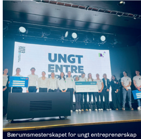
Bærumsmesterskapet for ungt entreprenørskap