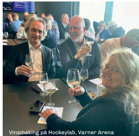
Vinsmaking på Hockeylab, Varner Arena