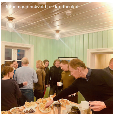
Informasjonskveld for landbruket

Årlig etablerer det seg flere hundre nye bedrifter i Bærum, og vi skal være de første som ønsker nyetablerte bedrifter velkommen på næringslivsarenaen.