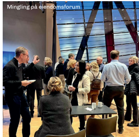
Mingling på eiendomsforum